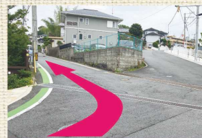
B 自動車学校前を左