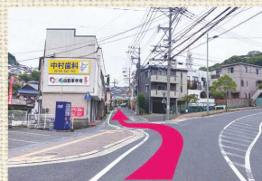
A 田上交差点を過ぎて左