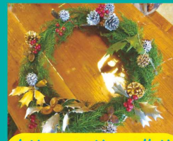
クリスマスリース作り